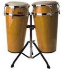
Tambour 1 micro