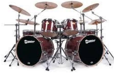
Micro pour battery 1 micro vocal