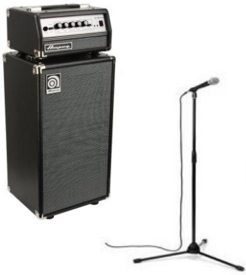
1 Micro pour gong